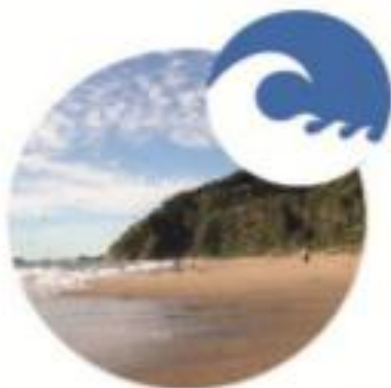
Marejadas / tsunamis