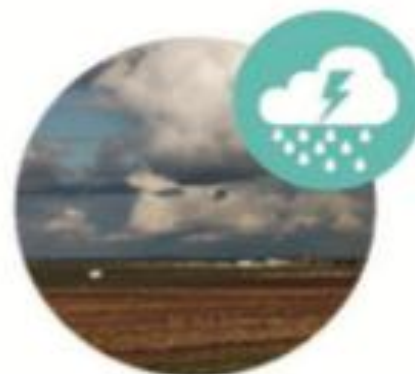
Inundaciones / sequías