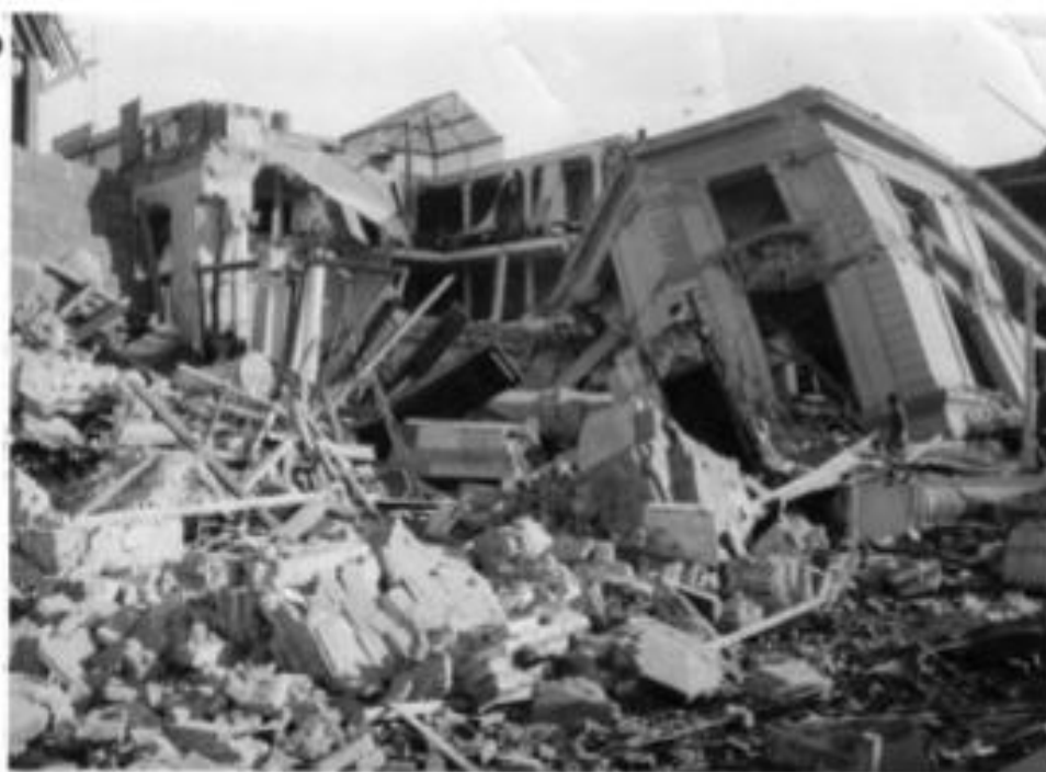
Terremoto de mayor magnitud registrada en el mundo