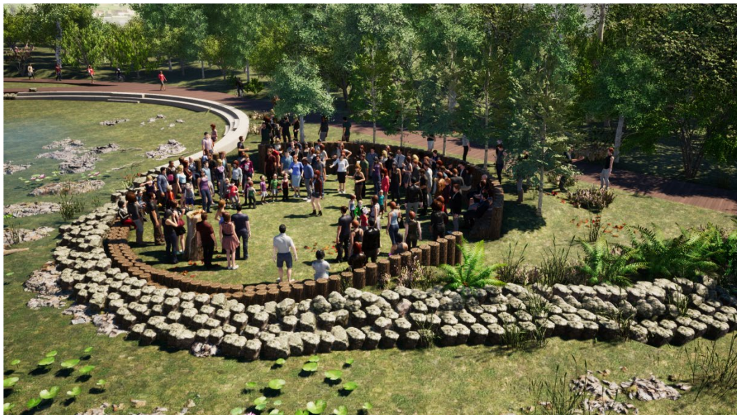
Imagen N° 6. Diseño del Centro Ceremonial