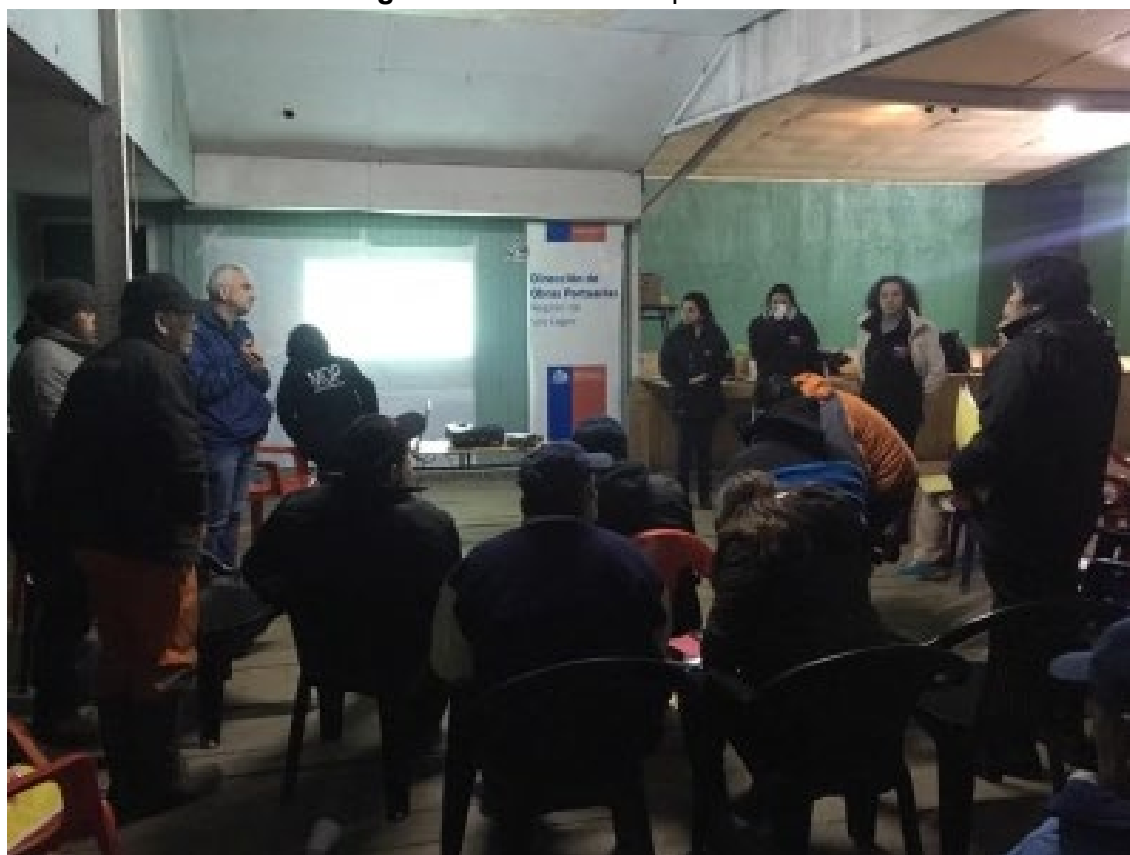
Imagen N° 9. Reunión Etapa de Planificación

La convocatoria a la primera reunión de planificación fue realizada según el punto 3.3 de este documento.