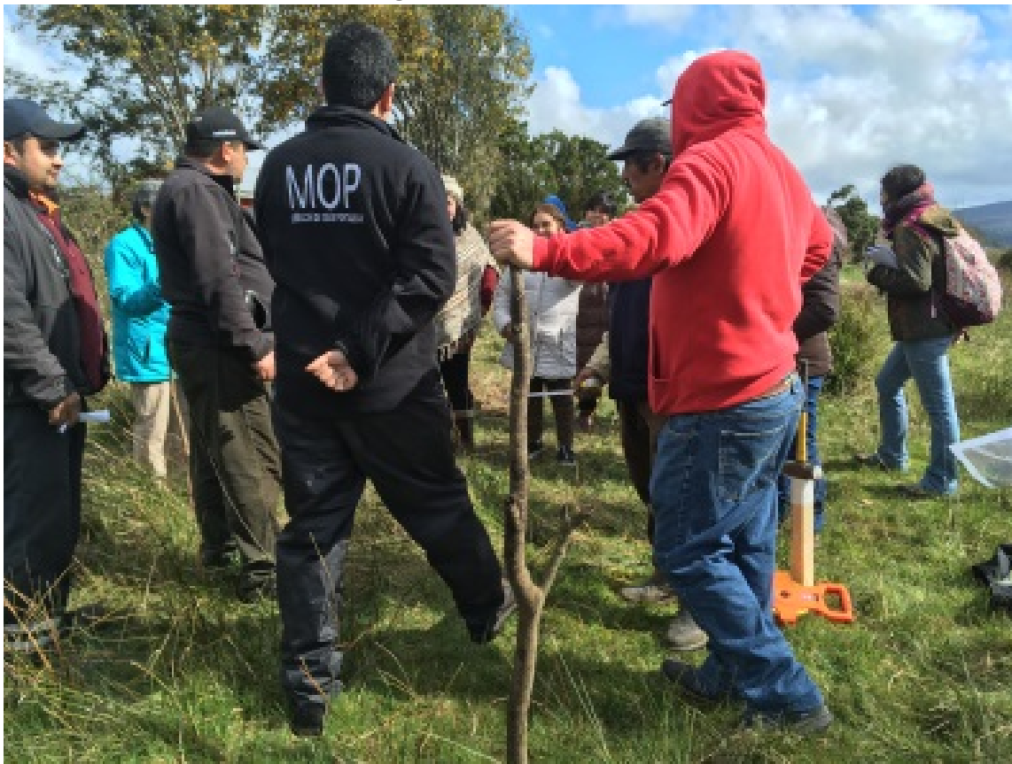
Imagen N° 10. Reunión en Terreno.