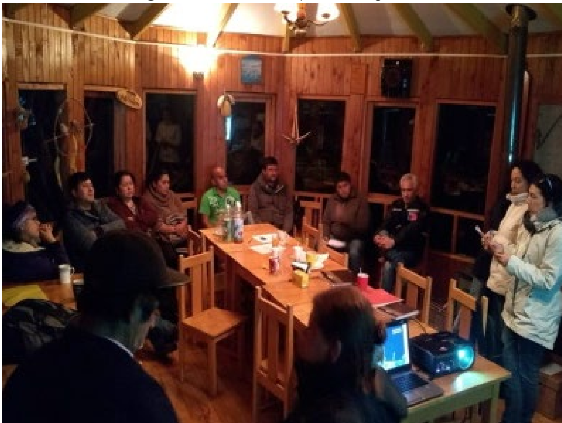
Imagen N° 11. Reunión Etapa de Entrega de Información.

La convocatoria a la reunión de Entrega de Información fue realizada según el punto 4.2.1.1 de este documento, además de avisos radiales difundidos días antes de la reunión