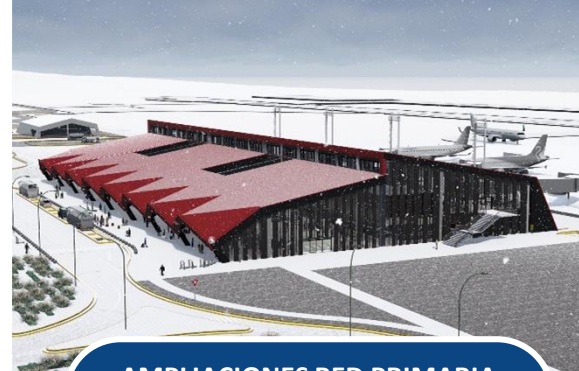
AMPLIACIONES RED PRIMARIA AEROPORTUARIA

Obras en pequeños aeródromos para mejorar infraestructura que utiliza CONAF para el control aéreo de incendios forestales.