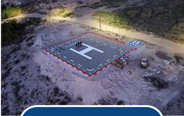
SOPORTE AÉREO EMERGENCIAS

Continuidad de Plan ISAE para completar meta de habilitar más de 100 puntos de posada de emergencia para helicópteros (PPH) durante este gobierno.