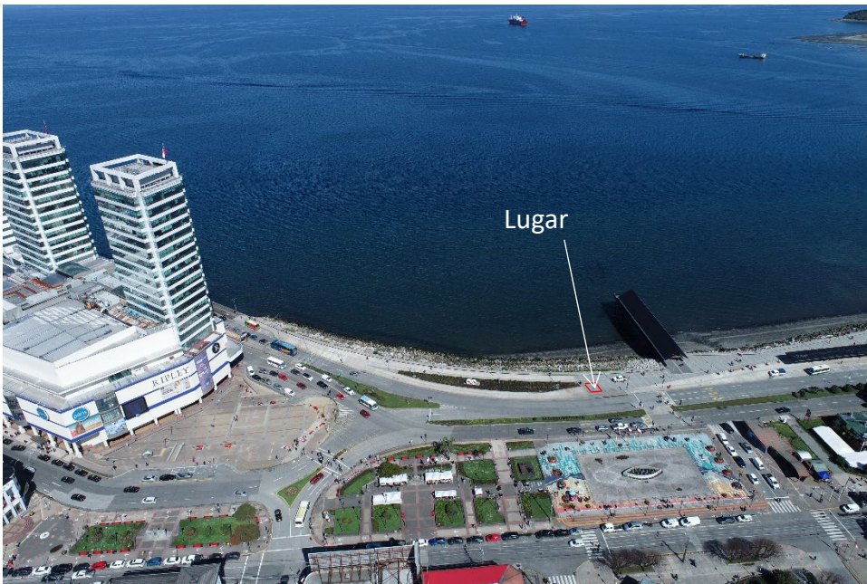
Vista 02 – Zona de vereda peatonal Parque Costanera