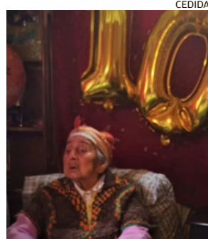
LA LONGEVA VECINA DE LA COSTA.

Agregó que “por eso insistimos en que la tarifa debe mantenerse congelada, también debido a que como Estado queremos hacernos cargo de los mayores costos operacionales inyectando recursos al sistema para que no sean las familias de Osorno quienes asuman”. ☞